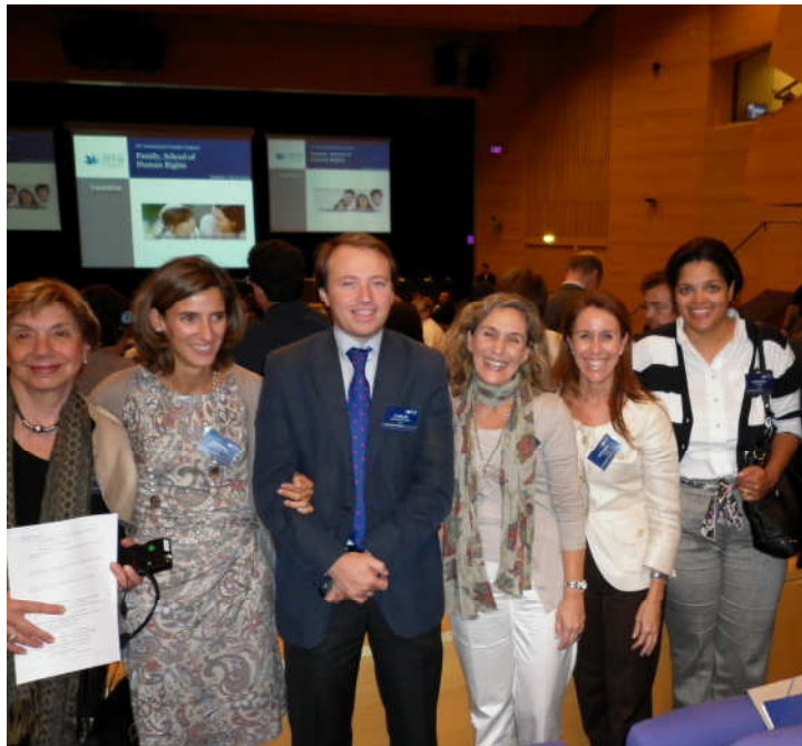
Algunos miembros de la Junta Directiva de IDEFA en el Congreso Internacional de Valencia.

En el Congreso se abordó el tema de “La familia, escuela de derechos humanos”, en él participaron más de 1.000 personas de 51 países de los cinco continentes, lo cual ha supuesto un gran éxito de asistencia y el logro de todos los objetivos previstos.